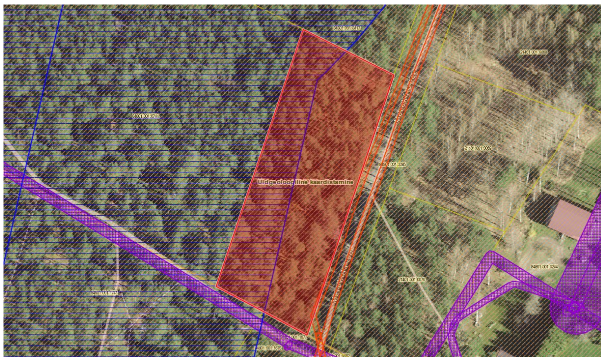
Joonis 2. Maa-ameti kitsenduste kaardi väljavõte (Allikas: Maa-ameti Geoportaal)