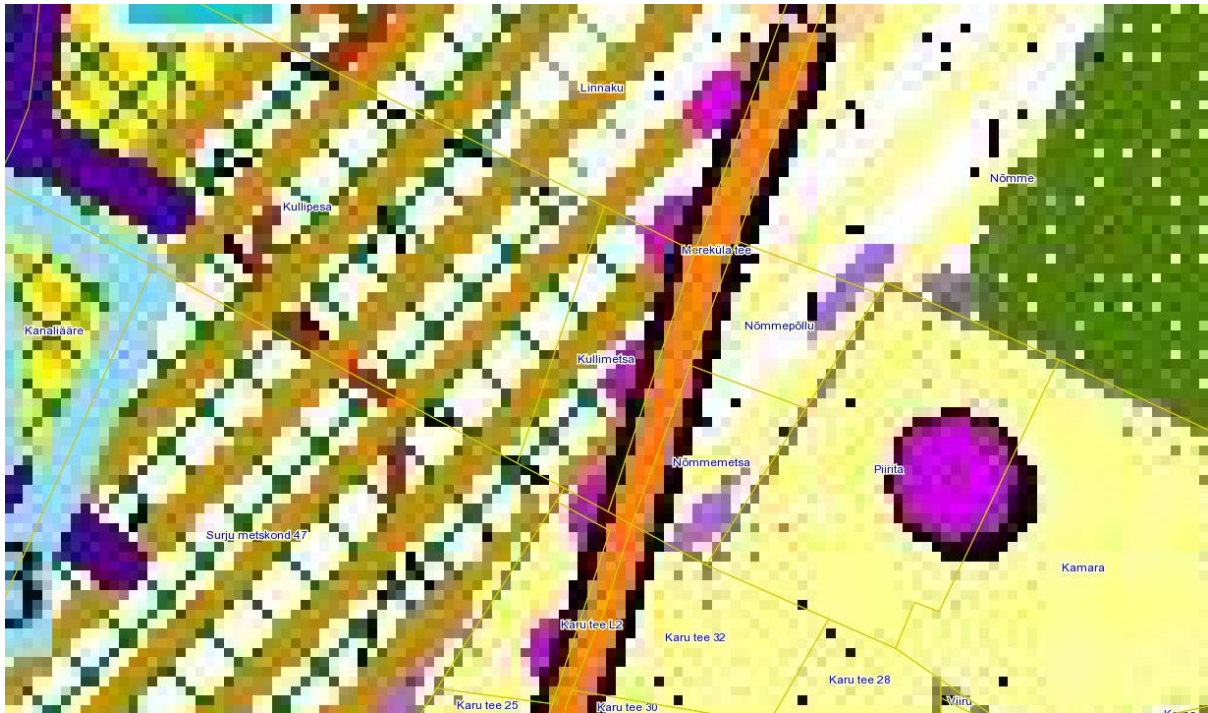
Joonis 1. Kehtiva Tahkuranna valla üldplaneeringu väljavõte

Ühepereelamu ehitamiseks lubatud krundi minimaalne suurus väikeelamumaal on 2200 m 2 . Väljaspool väikeelamumaad on ühepereelamu ehitamiseks lubatud krundi minimaalsuurus 2 ha. Viimast rakendatakse üldplaneeringu põhijoonisel näidatud valgete aladel. Antud juhul tehakse detailplaneeringuga ettepanek muuta Kullimetsa kinnistul maakasutuse juhtfunktsioon väikeelamumaaks.